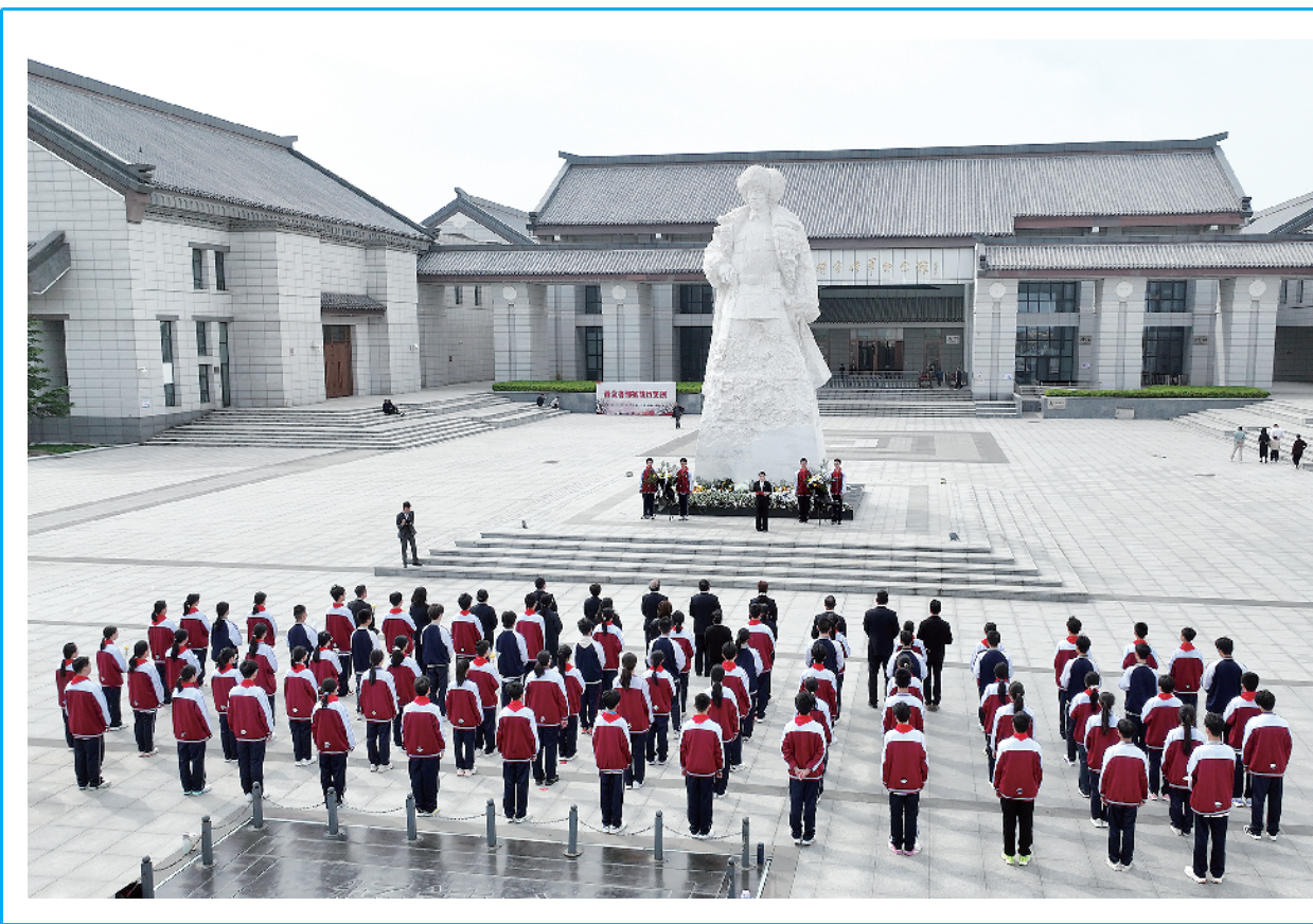
4月2日,人们在河南省驻马店市杨靖宇将军纪念馆开展祭奠英烈活动。