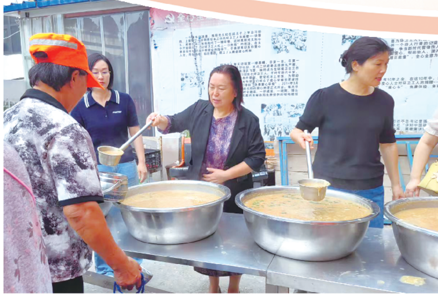
县政协组织部分政协委员开展志愿服务。

征程万里风正劲,重任千钧再出发。县政协党组书记、主席朱希炎表示,“1+2+N”基层高效能治理工作法是县政协立足本职、服务大局的创新探索,也是县政协践行人民政协为人民理念的具体实践。下一步,县政协将持续完善这一工作法,不断优化协商平台、建强调解队伍、健全长效机制,推动政协协商与基层治理同频共振、深度融合,努力把“太康协商”品牌擦得更亮,为建设更高水平的平安太康、幸福太康贡献更多智慧和力量。