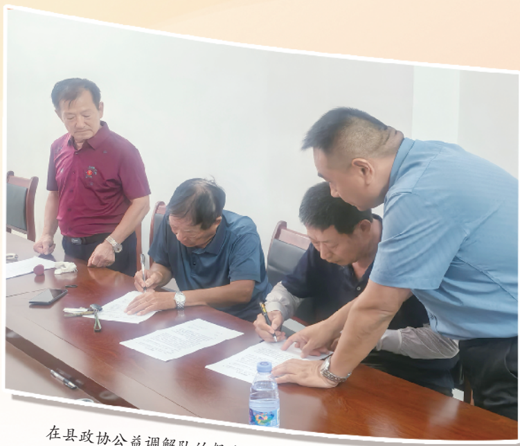
在县政协公益调解队的努力下,当事人签订调解协议。