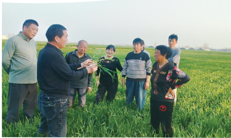
2026年3月30日,县政协组织农业专家为群众讲解春耕知识。

以监督促实效,当好“监督员”。协商达成的共识能否落地,关键在监督。县政协将民主监督嵌入基层治理流程,对协商议定事项、民生实事办理及矛盾纠纷化解等实行全程跟踪监督。组织政协委员开展常态化视察和评议,对推进不力、成效不佳的事项及时提出意见建议,督促相关部门加快整改。同时,发动群众参与监督,鼓励群众对基层治理工作“评头论足”,确保每一件民生实事都办实办好、每一起矛盾纠纷都化解到位,实现“民有所呼、我有所应、应必有果”。