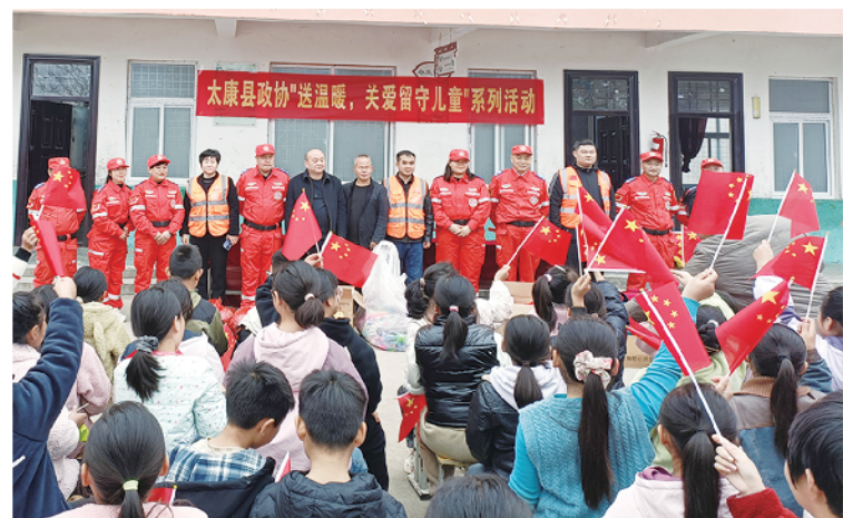
县政协联合县红十字会为留守儿童送温暖。