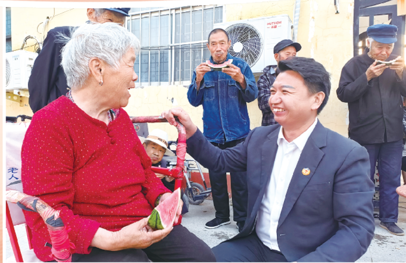
政协委员看望留守老人。