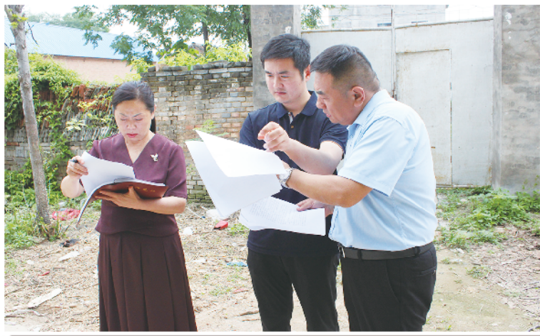
政协委员查阅资料,了解群众诉求。