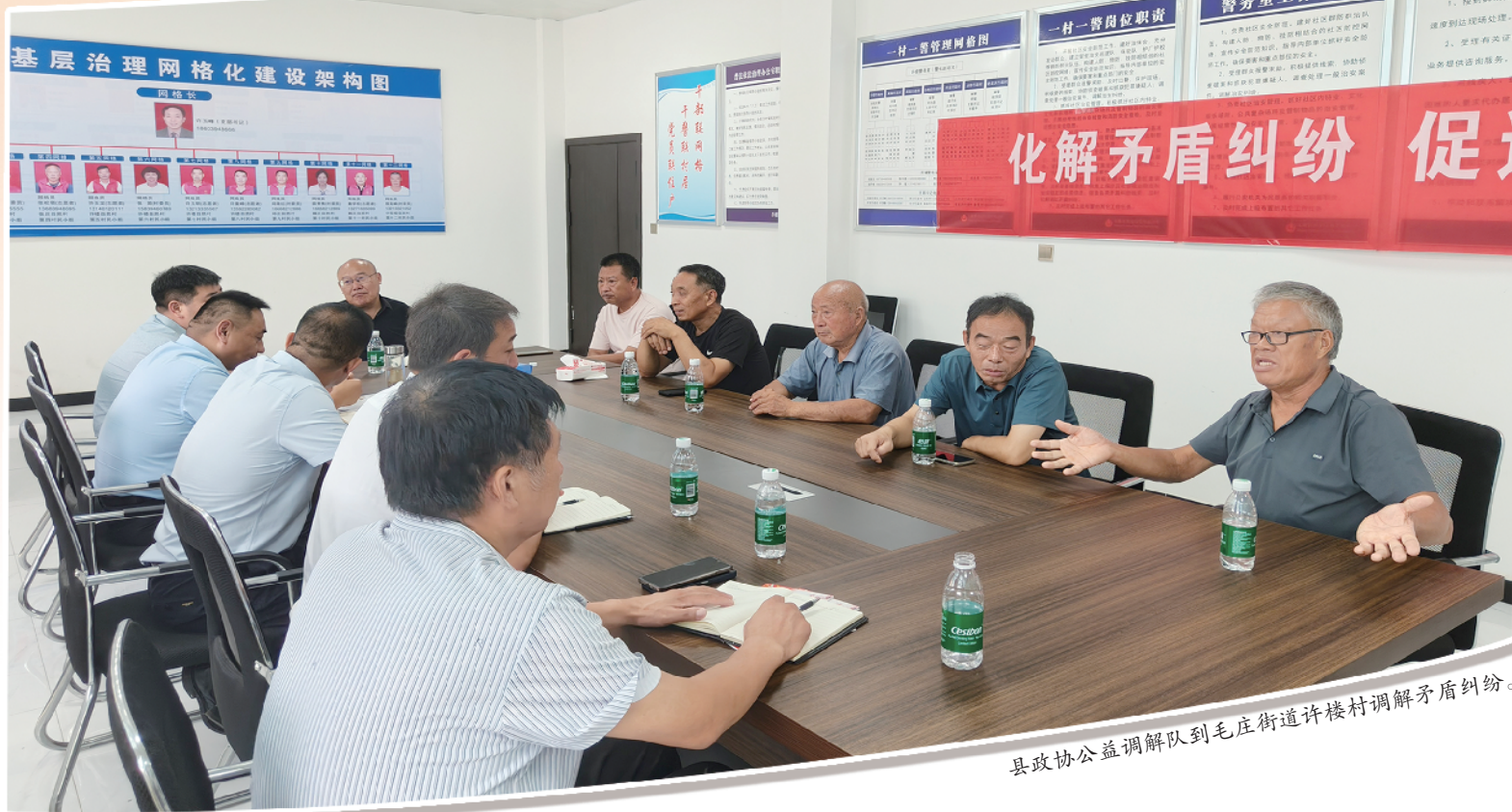
县政协公益调解队到毛庄街道许楼村调解矛盾纠纷。