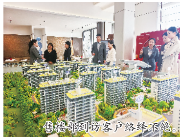
售楼部到访客户络绎不绝。